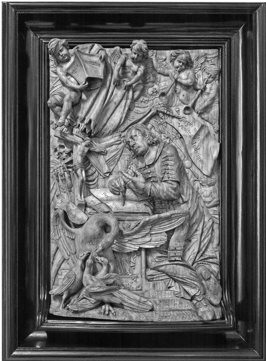
Fig.1: Chr. D. Schenck: Bildnis eines Geistlichen, Lindenholz, 1672. München, Privatbesitz (Abb. aus: Beatrice Södung: Das allegorische Bildnis ..., S.207)

Werk zu handeln und Schenck selbst müsste zumindest 1672 (wieder) in Konstanz gewesen sein. Dass die Annuierung nicht an den Stufen mit der Herstellersignatur sondern auf einem dargestellten Buch angebracht ist, könnte wie die Bearbeiterin richtig erkannte, einen besonderen Grund gehabt haben, z.B. dass auf ein früheres Ereignis wie