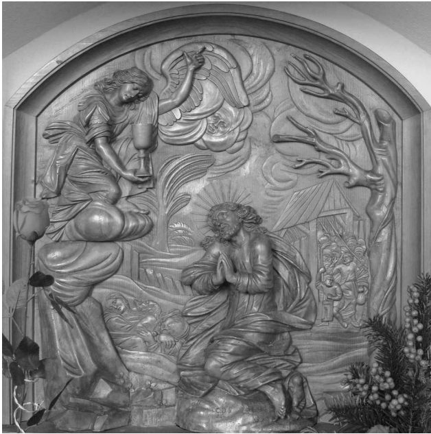
Fig.2: Chr.D.Schenck: Christus am Ölberg, 1679. Ittendorf, Pfk.